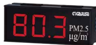
顯示字體：4" 3位數單層顯示 外框尺寸：長15cm×寬37cm×厚7cm