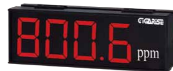
顯示字體：4" 4位數單層顯示 外框尺寸：長15cm×寬45cm×厚7cm