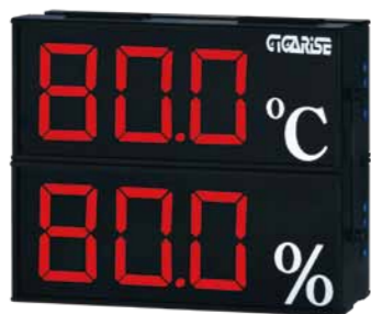
顯示字體：4" 3位數雙層顯示 外框尺寸：長30cm×寬37cm×厚7cm