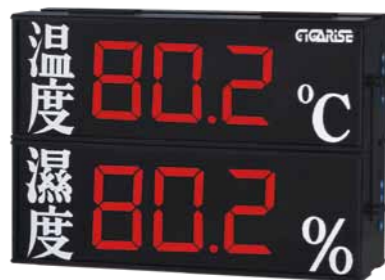
顯示字體：4" 3位數加中文雙層顯示 外框尺寸：長30cm×寬45cm×厚7cm