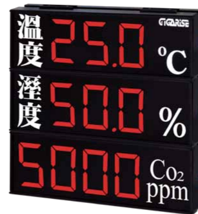
顯示字體：4" 3+4位數混合加中文參層顯示 外框尺寸：長45cm×寬45cm×厚7cm