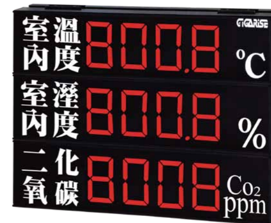
顯示字體：4" 4位數加參欄中文參層顯示 外框尺寸：長45cm×寬65cm×厚7cm